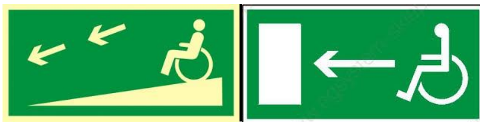
DROGA EWAKUACYJNA DLA OSÓB Z NIEPEŁNOSPRAWNOŚCIAMI