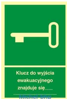
OZNACZENIE GDZIE ZNAJDUJE SIĘ KLUCZ