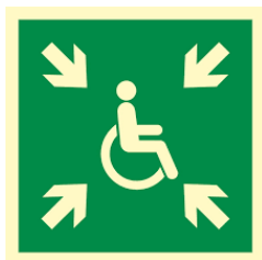
PUNKT ZBIÓRKI OSÓB Z NIEPEŁNOSPRAWNOŚCIAMI